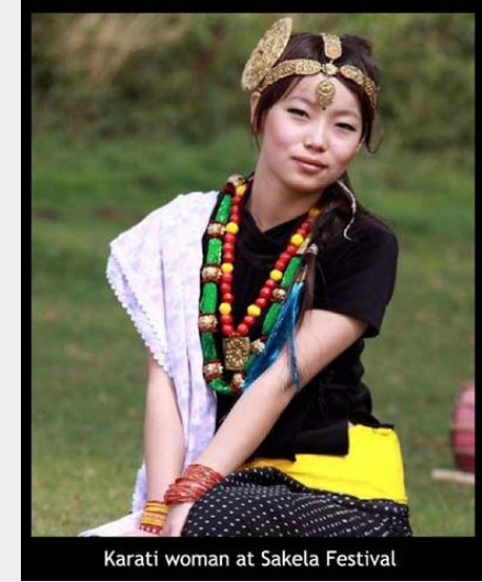
Karati woman at Sakela Festival